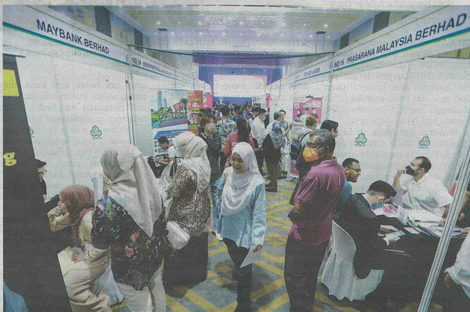
ORANG ramai mengunjungi karnival pekerjaan melibatkan pelbagai sektor. – GAMBAR HIASAN

“Ini sekali gus mencerminkan pasaran tenaga global yang masih tidak menentu akibat risiko geopolitik,” katanya.