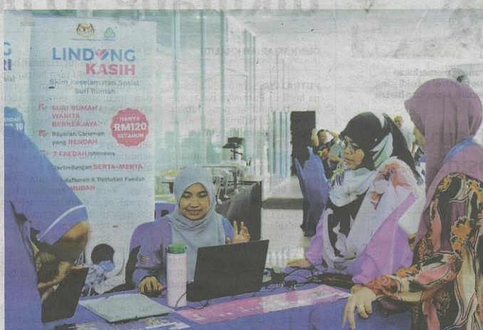
PERKESO turut memperkenalkan skim Lindung Kasih sebagai tanda penghargaan bagi melindungi suri rumah daripada risiko kemalangan atau kematian.

kerja," katanya kepada Utusan Malaysia .